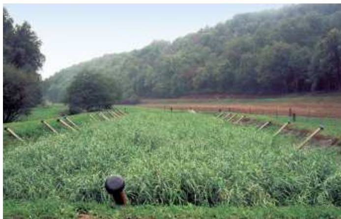
« Les filtres sont parfaitement intégrés dans l'environnement. »

Le dispositif ne permet pas de traiter le lactosérum, le lait invendu, les effluents d'aire d'attente. Le lactosérum peut être utilisé en alimentation animale, les autres effluents stockés et épandus sur parcelle ou sur le tas de fumier.