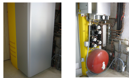
Chaudière mixte solaire/gaz